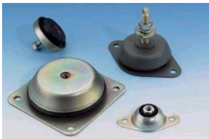
Abbildung 1: Diverse Maschinenfüße zur elastischen Lagerung von schwingenden, bzw. vibrierenden Anlagen und Geräten geringeren oder mittleren Gewichts, die für sehr unterschiedliche Belastungen angeboten werden. Die Skizze rechts zeigt eine Zeichnung von einem Schwingmetall-Topf-Element, wie es auch im Bild zu sehen ist.

Im Folgenden werden einige praktisch bewährte Lagerungselemente vorgestellt, mit denen diese Bedingung erreicht werden kann. Die insgesamt schwingende oder vibrierende Masse m_{ges} ist in der Praxis im Allgemeinen vorgegeben. Somit verbleibt nur noch die Suche nach einer geeigneten elastischen Lagerungsmöglichkeit. Davon gibt es eine Fülle auf dem Markt, angefangen