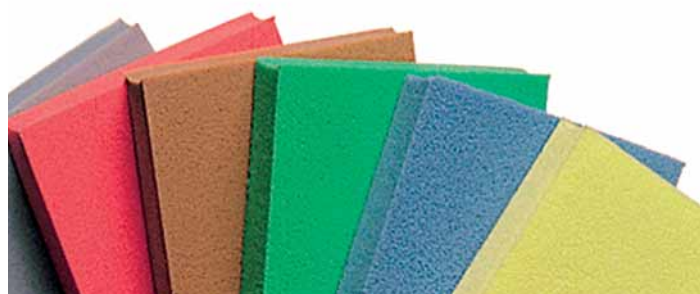
Abbildung 2: Federnde Unterlagen aus elastomerem Material unterschiedlicher Dichte und Elastizität, die als druckbelastete Nachgiebigkeiten zur elastischen Lagerung von größeren Geräten, Anlagen oder auch Maschinen dienen. Die verschiedenen Farben kennzeichnen die Dichten und Lastbereiche.

Frühere Beiträge unserer Serie „Akustik kompakt“ können Sie auf unserer Website unter der Rubrik „Akustik“ nachlesen.