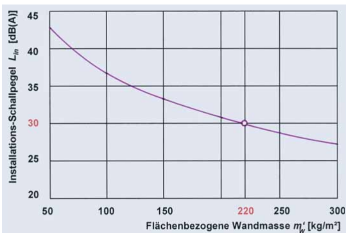
Bild 1. Abhängigkeit des zu erwartenden Installations-Schallpegels L_{in} von der flächenbezogenen Masse m'_w der Installationswand.

L_{in} ist dabei der so genannte Installations-Schalldruckpegel ,