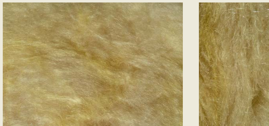
Abbildung 2 Beispiel für einen Glaswolle-Faserdämmstoff, wie er vom Hersteller (Isover, Typ TP 1, Strömungswiderstand \Xi > 5 \text{ kNs/m}^4 ) für den Innenausbau Wand/Decke angeboten wird. Links: Draufsicht; rechts: Seitenansicht; man erkennt hier deutlich die lockere Materialschichtung. (Die Materialprobe wurde dem Autor von der Firma Saint-Gobain Isover G+H AG zur Verfügung gestellt)

Aus dem Verhältnis der maximalen und minimalen Schalldruckwerte erhält man das Stehwellenverhältnis